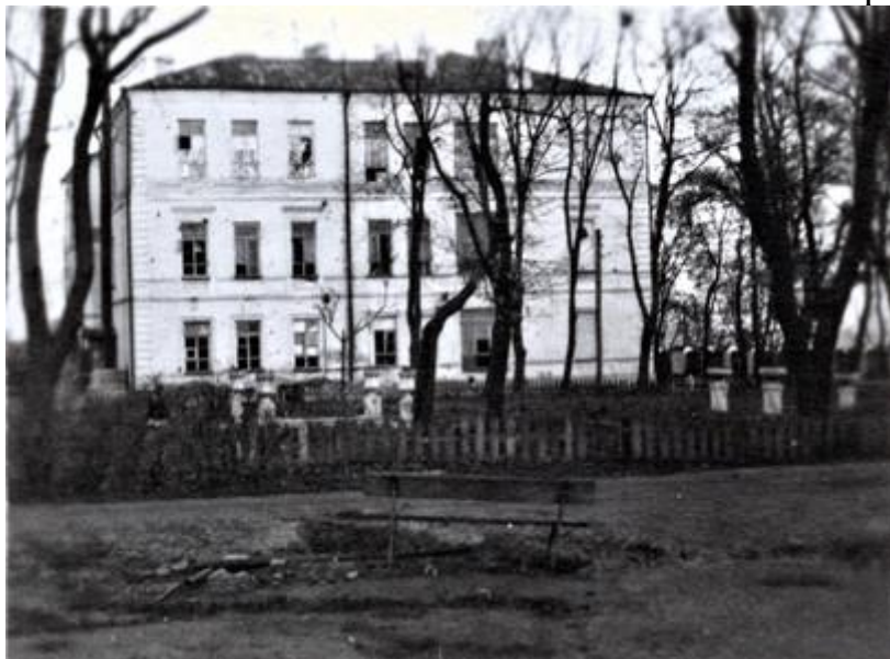
Здание больницы, где размещался госпиталь 172-й стрелковой дивизии, немецкое фото, 1942 год.